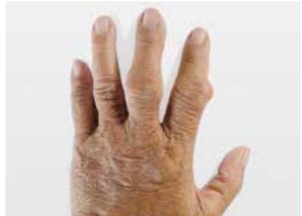
Gichtknoten an den Fingern