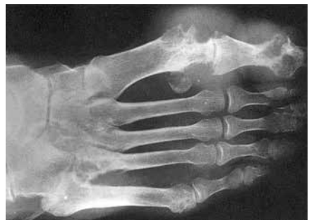
Gelenkdestruktion durch Gicht